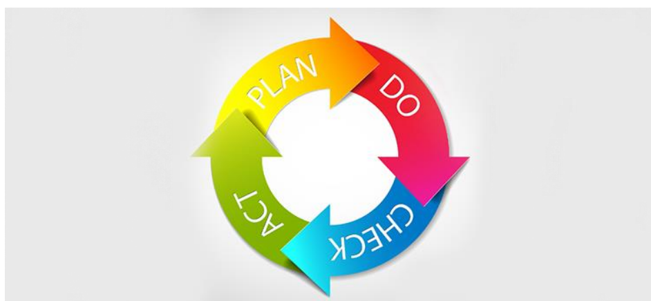
Figura 4 Ciclo PDCA