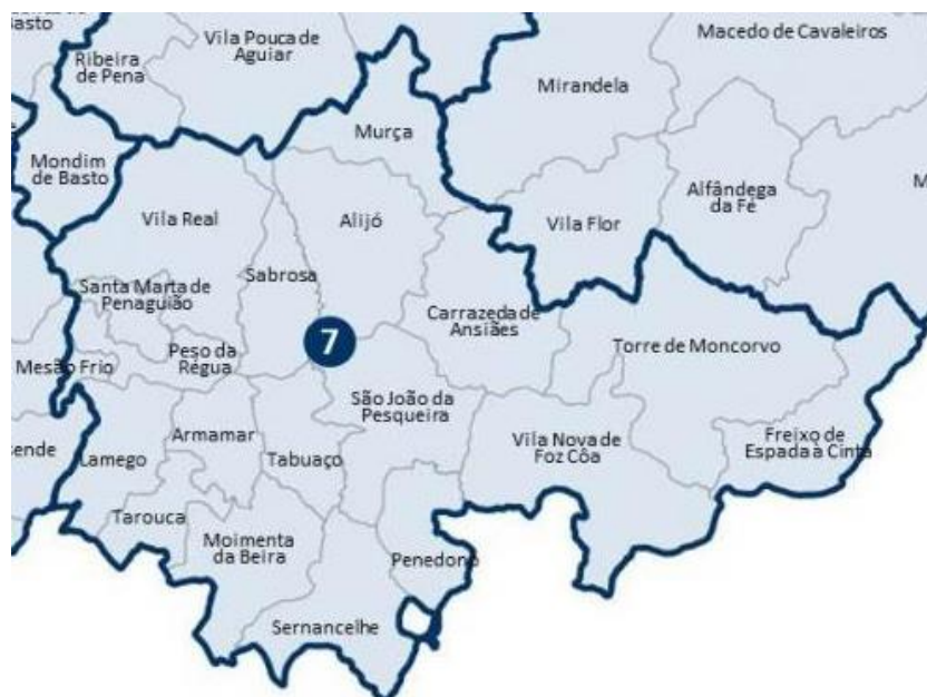
Figura 1 Mapa da CIM - Douro